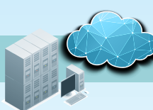
FTPサーバー/クライアント