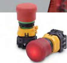
非常停止用押ボタンスイッチ