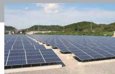
再生可能エネルギー事業