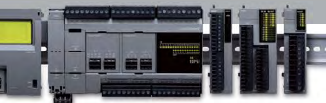
プログラマブルコントローラ