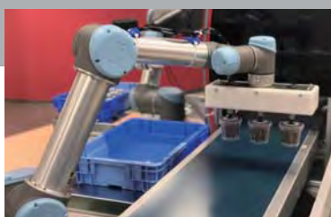
協調安全ロボットシステム