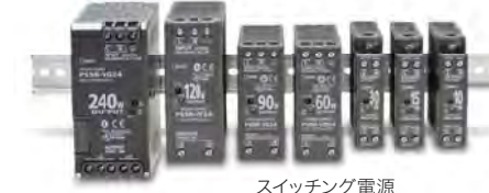
スイッチング電源