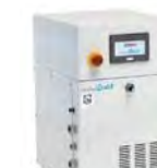
ウルトラ ファインバブル 発生装置