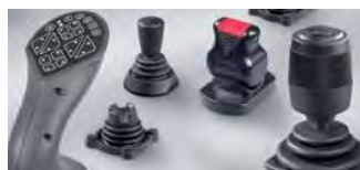
ジョイスティック