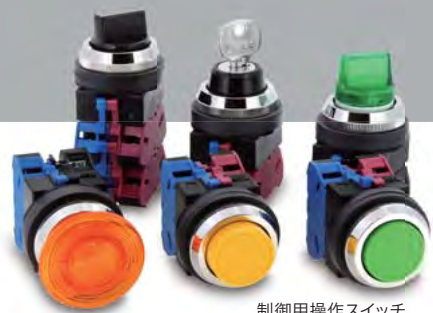
制御用操作スイッチ