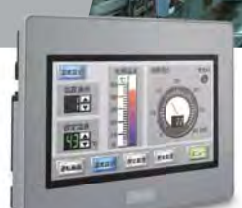
プログラマブル表示器