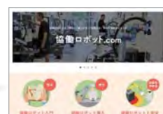
協調ロボット.comの運営