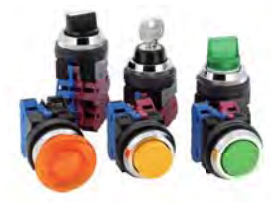
■ 制御用操作スイッチ