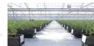
次世代農業ソリューション