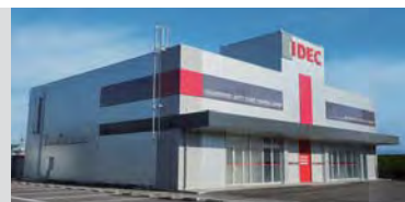
協調安全ロボットテクニカルセンター(愛知県)

愛知県と東京都に協調安全ロボットテクニカルセンターを設立し、ロボットの活用方法や安全なシステム構築方策の提案に加え、顧客ニーズにマッチした最適な協調安全ロボットシステムを提供しています。