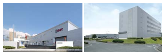
尼崎事業所 滝野事業所