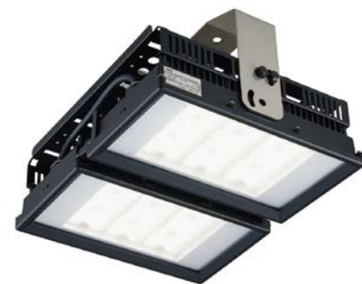
LG1H-200 シリーズ 212 タイプ (メタハラ 400W タイプ)